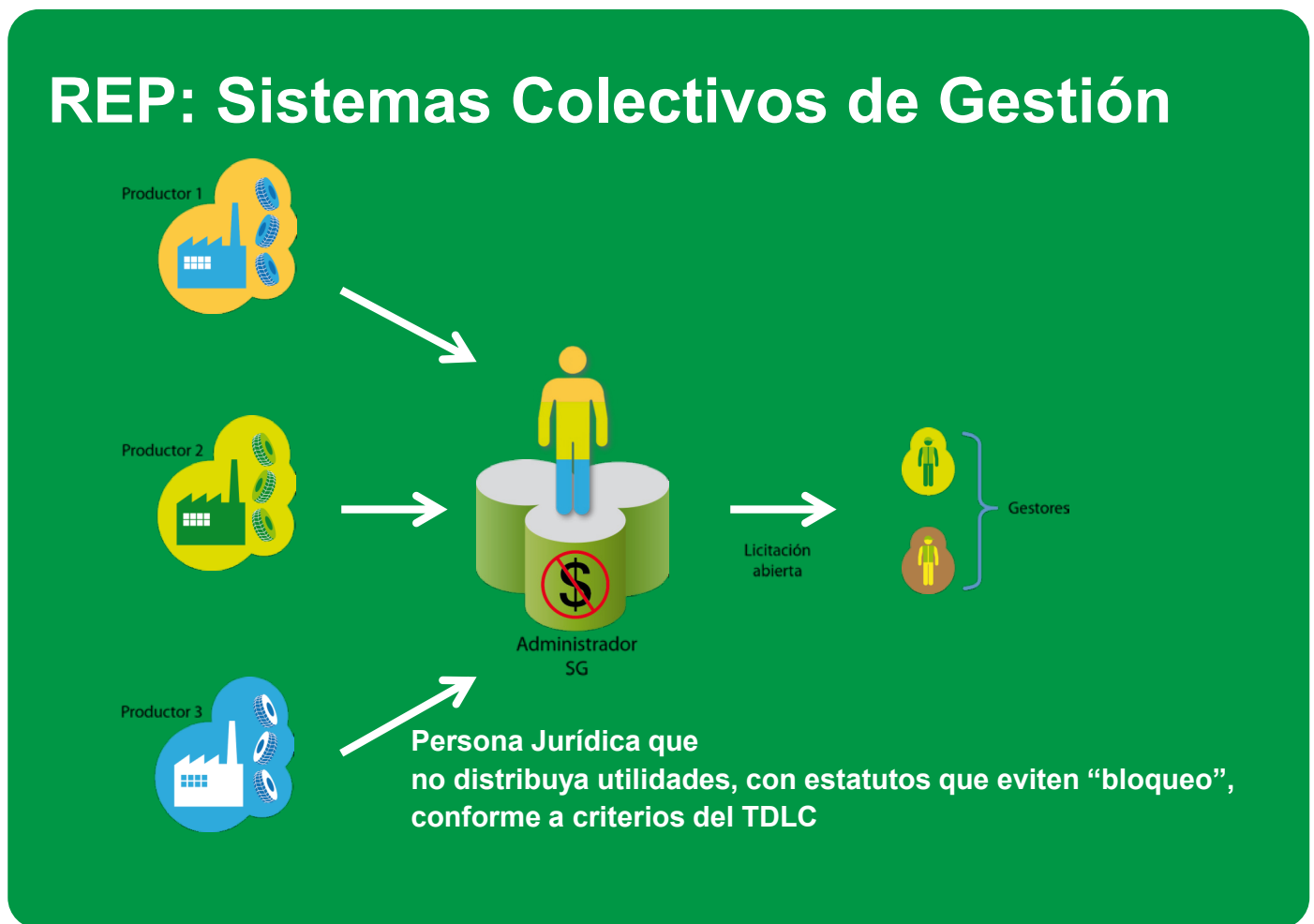
Figura 4. Sistema Colectivo de Gestión.

Los productores deberán financiar los costos en que incurra la referida persona jurídica en el cumplimiento de su función, en base a criterios objetivos, tales como la cantidad de productos comercializados en el país y la composición o diseño de tales productos, de conformidad a lo dispuesto en el decreto supremo que establezca las metas y otras obligaciones asociadas de cada producto prioritario.